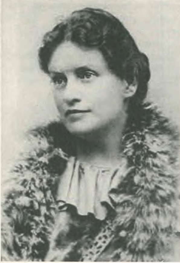
Lou von Salomé

1883 Böyle Buyurdu Zerdüşt, Herkes İçin ve Hiç kimse İçin Bir Kitap I ve II yayımlanır. Birinci bölüm Ocak ayında, yaklaşık on günde kaleme alınmıştır, ikinci bölüm ilkbaharda, üçüncüsü ise sonbaharda kaleme alınmıştır. Yılın başında derin ıstıraplar, baş ağrısı, uykusuzluklar. Kaçmaya çalıştığı kız kardeşi ve annesiyle ilişkileri giderek daha da gerilir. Editörüyle (Schmeitzner) tartışır. Nietzsche