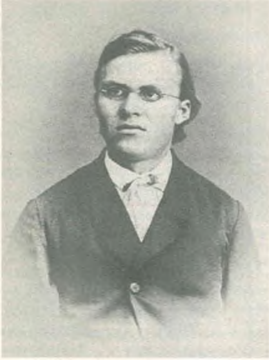
Nietzsche 20 Yaşında, 1864