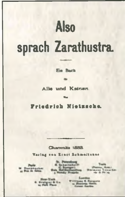
Böyle Buyurdu Zerdüş'tün orijinal baskısının kapağı, 1883