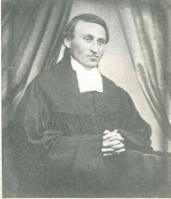
Karl Ludwig Nietscshe

1844 Nietzsche 15 Ekim'de, Kralın doğum yıldönümüyle aynı günde, Lützen yakınlarındaki Röcken'de doğdu. Babası Karl Ludwig (doğum tarihi 1813) papazdır. Ludwig de eşi Franziska da (doğum tarihi 1826) papaz ailesinden gelmektedirler.